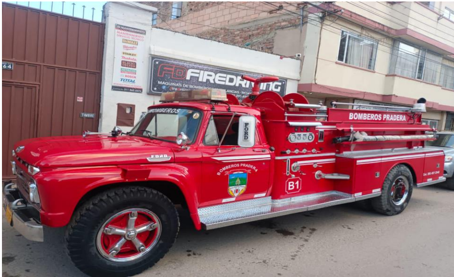
Llegada de la maquina b1 a la ciudad de duitama para repotencian