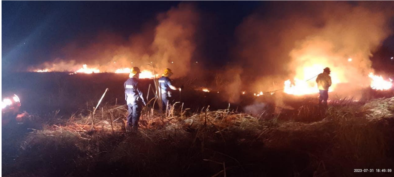
INCENDIO EN PASTIZAL JULIO 31 DE 2023