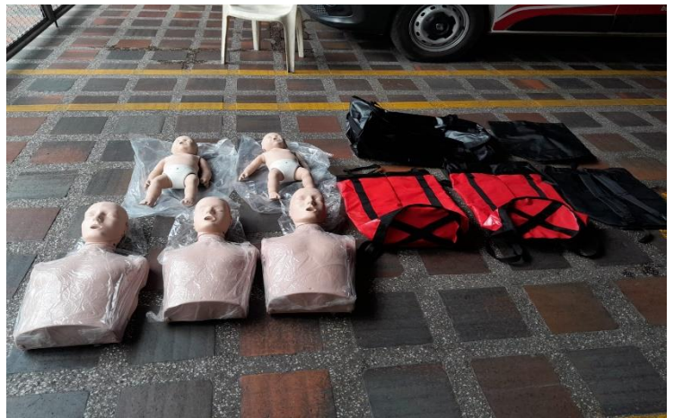
Compra de maniquies para capacitacion de RCP