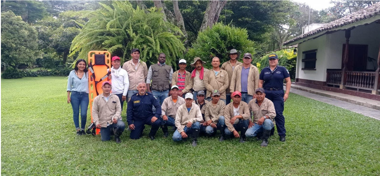
CAPACITACION EMPRESA VILELA SAS