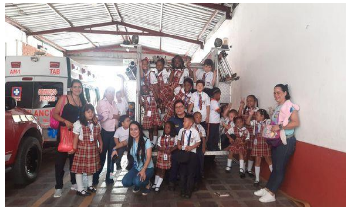
CAPACITACION I.E. MONTESSORI